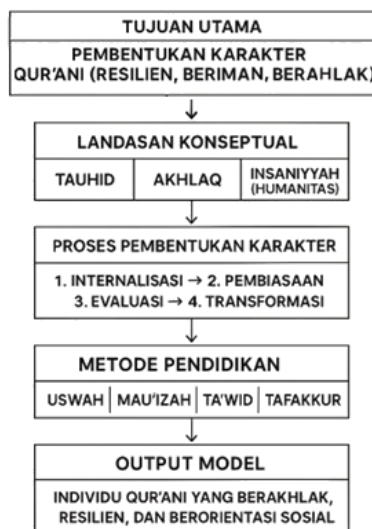
Grafik 2. Model Pendidikan Karakter Qur'ani Berbasis Surah Yusuf

Dari keseluruhan analisis, penelitian ini menghasilkan model konseptual pendidikan karakter Qur'ani berbasis Surah Yusuf yang memiliki tiga dimensi utama yang saling terintegrasi. Pertama, dari sisi landasan epistemik, model ini dibangun di atas sintesis antara berbagai sumber otoritatif dan kontekstual, yaitu tafsir klasik seperti Al-Ṭabari dan Al-Qurṭubi yang memberikan dasar normatif dan historis terhadap nilai-nilai pendidikan Qur'ani (Salsabila, 2023), tafsir modern seperti Quraish Shihab dan Sayyid Quthb yang menekankan pendekatan humanistik dan kontekstual dalam memahami relevansi nilai-nilai tersebut terhadap kehidupan modern (Hakim, 2023), serta teori pendidikan karakter kontemporer dari Thomas Lickona, Lawrence Kohlberg, Muslich, dan Majid & Andayani yang memperkuat aspek pedagogis dan psikologis dalam penerapan nilai-nilai Qur'ani di lingkungan pendidikan (Jacobus & Geor, 2024).